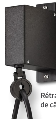
Rétracteur de câble