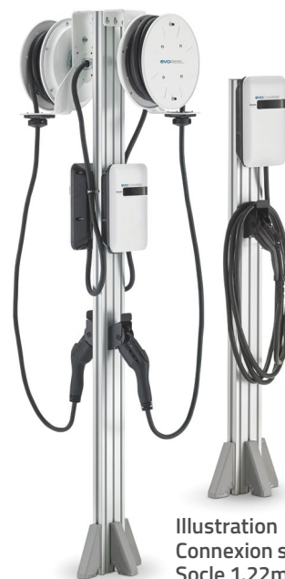
Illustration Connexion simple Socle 1.22m (4')