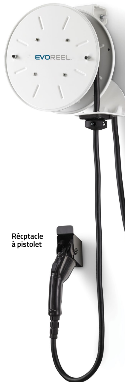
EvoReel® avec câble de recharge

Bornes de recharge avec réseau ouvert flexible OCPP (cellulaire wi-fi & LTE) et sans réseau